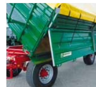
HKD 290 – 18 Tonnen zulässiges Gesamtgewicht

Stahlbordwände mit Gummiabdichtung sind in unseren Sondermodellen von 11 bis 18 Tonnen Gesamtgewicht erhältlich.