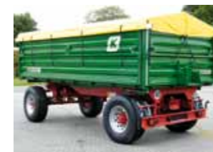
HKD 250 – 16 Tonnen zulässiges Gesamtgewicht (weiterhin sind diese Kipper auch mit 11 und 14 Tonnen zulässiges Gesamtgewicht lieferbar – optisch ähnlich HKD 250).

Sie möchten Ihr Fahrzeug auch für ganz spezielle Einsätze nutzen? Nennen Sie uns Ihre Anforderungen, und unsere erfahrenen Konstrukteure erarbeiten Ihnen praxisnahe Vorschläge. Für nahezu jedes Transportproblem gibt es die passende Lösung.